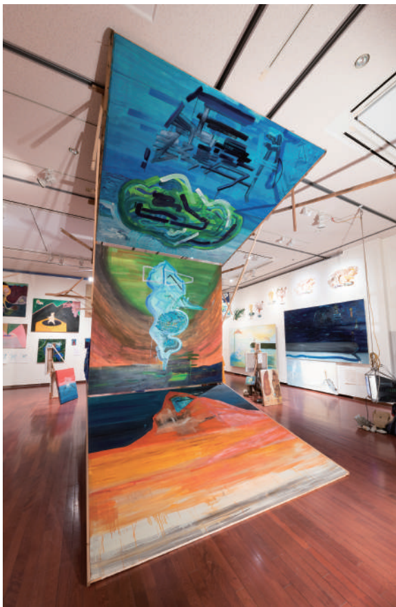
《Neo New シン木》 Neo New Shin Ki 2021 / インスタレーション 2021, installation