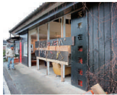
天草在郷美術館 外観 2009

Kato set up a space called "Amasa Zaigo Museum of Art" in the middle of the rice fields in the Amakusa region where he has lived for nearly ten years since 2005. Although referred to as a "museum," it is a renovated old work hut, which smells of soil from rice fields and where insects also enter. Kato organized various projects within this space, including exhibitions of contemporary art, crafts, paintings by capital inmates, fishing and farming utensils, physical performances with ties to the local region and culture, as well as athletic festivals in the rice fields.