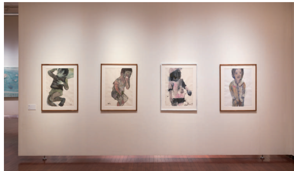
《無題》 Untitled 2017-2018 / アクリル、墨、紙 2017-2018, acrylic, ink on paper