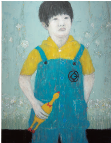
《さがしもの》 2021 / アクリル、色鉛筆、キャンバス Looking for 2021, acrylic, colored pencil on canvas