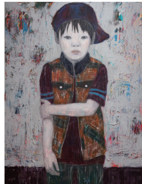
《いつかの子》 2021 / アクリル、色鉛筆、キャンバス