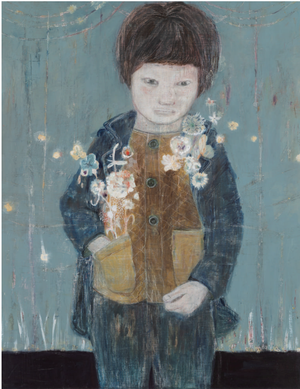
《ポケットの中の》 2017 / アクリル、色鉛筆、キャンバス