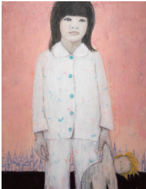
《浮遊》 2020 / アクリル、色鉛筆、キャンバス Floating 2020, acrylic, colored pencil on canvas