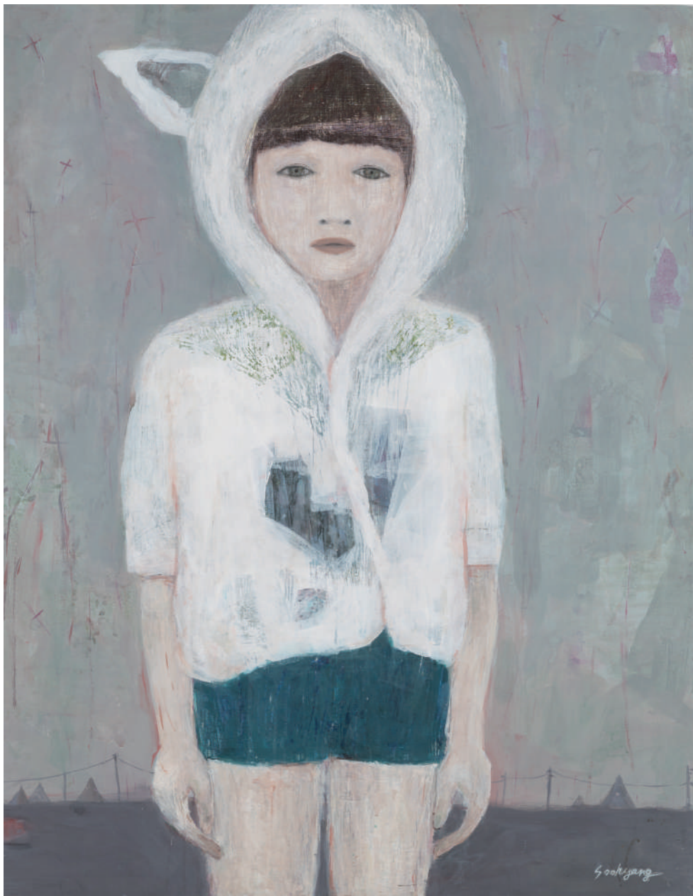
《リトルメロディ》 2016 / アクリル、色鉛筆、キャンバス