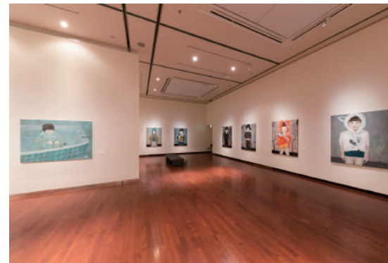
会場風景 Installation view

私が現在制作しているのは 限られたコミュニティの中で垣間見た 子供たちを取り巻く世界や 水、空想、物語といった彼らと親和性の高い要素を 生活の中から拾い集めた作品群です。