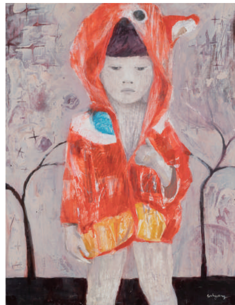
《赤いマントの子》 2015 / アクリル、色鉛筆、キャンバス