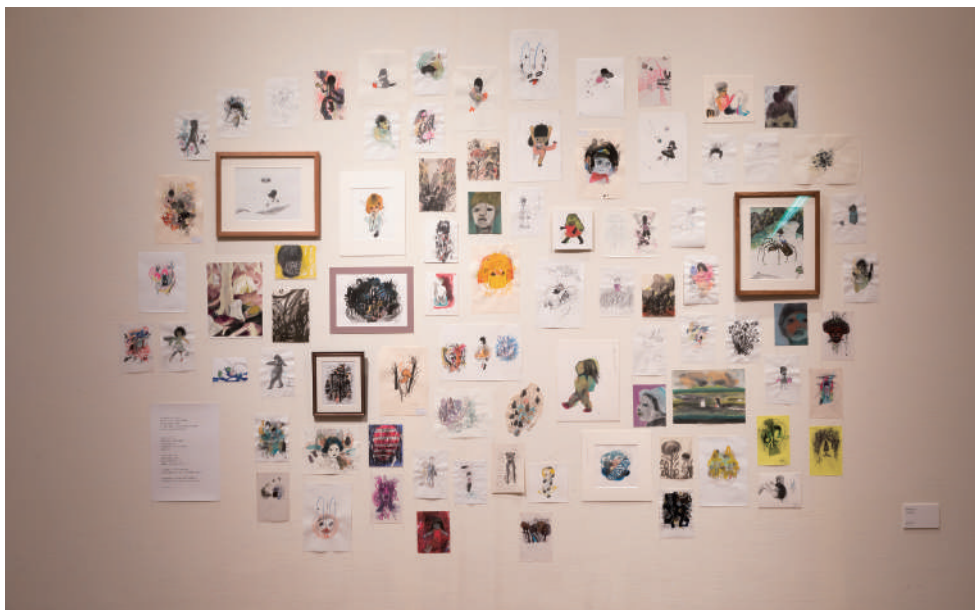
《日々のこと》 Daily things 2016-2021 / アクリル、墨、紙 2016-2021, acrylic, ink on paper