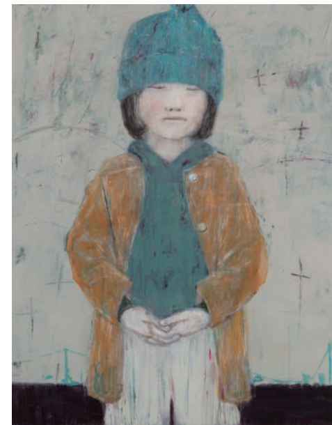
《かえで》 2017 / アクリル、色鉛筆、キャンバス