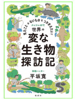
みんなの研究シリーズ [徳成社] (2022~)