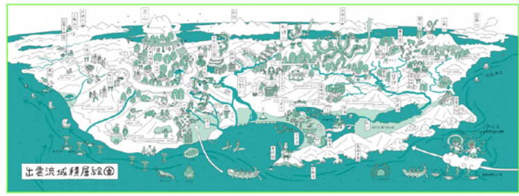
出雲流域積層絵図 (2024)

*各種ワークショップの詳細や申込方法は、当館ホームページをご確認ください。 *会期中、ART LAB MARKETでは、いつでもだれでも参加できるワークショップも実施予定です。