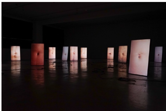
5. 《Bellybutton and Breathing - お臍と呼吸》2022