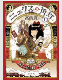
高浜寛 『ニクスの角灯』1巻書影 ©Kan Takahama

天草出身・熊本在住のマンガ家・高浜寛の個展。貴重な原画とともに、マンガに登場する高浜のアンティーク・コレクションを大公開。時代考証にこだわる仕事の深みと、歴史マンガの中に「いま」を映す鋭い感性に触れる展覧会です。