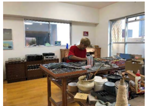
左：熊本市現代美術館内の旧アトリエ（キッズファクトリー）