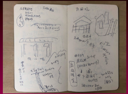
いいしんじ 新作「百ものがたり(仮)」取材ノート 2021年 ※会場にて新作を初公開いたします