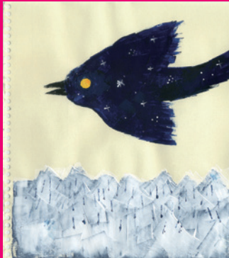
コーダ・ヨーコ 「ヨルのキオク」01あしたを運ぶ鳥 2016年 個人蔵 ©コーダ・ヨーコ