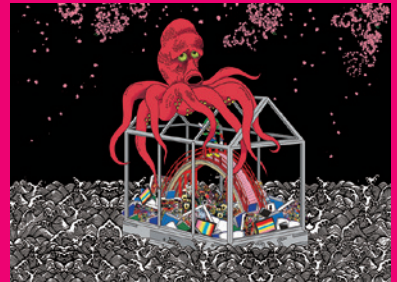
田名網敬一 赤い陰影 2021年 作家蔵 ©Keiichi Tanaami Courtesy of NANZUKA