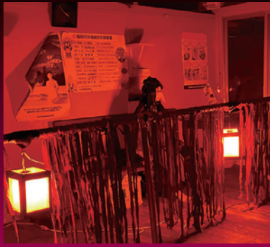
南無サンダー 南無サンダーの演劇お化け屋敷@大學湯 会場内風景 2020年(参考)