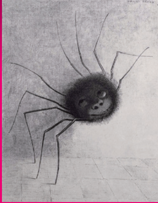
オディロン・ルドン 蜘蛛 1887年 岐阜県美術館蔵 ※前期展示