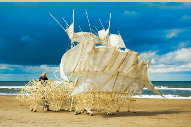
《アニマリス・ブラウテンヌ・ヴェーラ》 2013 アウルム期

風を動力源としてオランダの砂浜を疾駆する「ストランド（砂浜）ビースト（生命体）」。 ボディ全体は黄色いプラスチックチューブで造形され、物理工学を基盤としたその動きは生き物を思わせるほどに滑らかで有機的です。それらはオランダのアーティスト、テオ・ヤンセン（1948-）によって故国の海面上昇問題を解決するために生み出されました。作者亡き後も自立して砂浜で生き延びることを目指し、ストランドビーストは歩行、方向転換、危険察知などの機能を備え、さまざまな環境に適応していくためのシステムを獲得していきます。生と死を繰り返し、遺伝子と遺伝情報を受け継ぎながら進化し続けてきた生命体は、芸術と科学という既存のカテゴリーを横断し、新たな可能性を私たちに提示しています。本展では全長10mを超えるストランドビーストを含む10作品以上を紹介。実際に動く様子も体感できます。