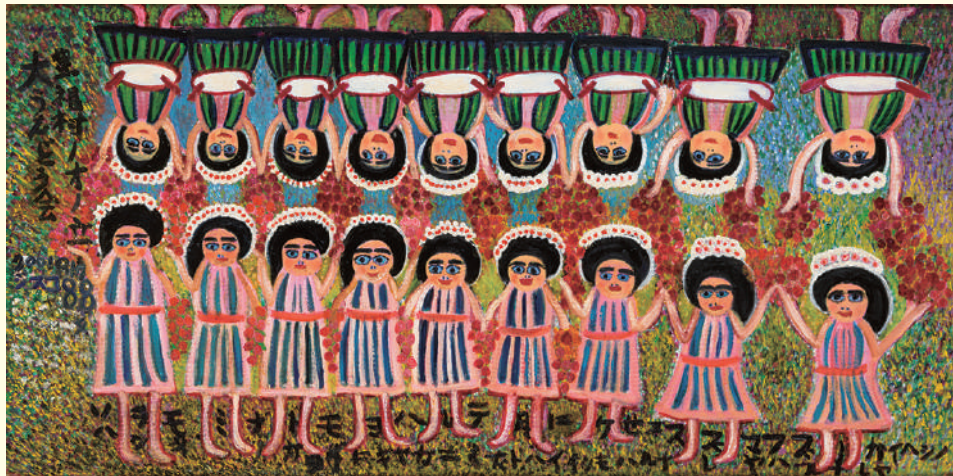
《オノダチの大運動会》 | Athletic Meet in Onodachi 2001年 段ボール、油彩、アクリル絵具、フェルトペン