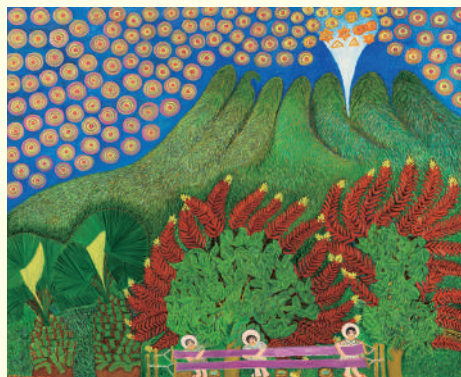
《桜島》 | Sakurajima 1970~1988年 キャンバス、油彩