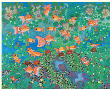
《金魚 大和錦の産卵》 | Yamato Nishiki Goldfish Laying Eggs 1992年 キャンバス、油彩