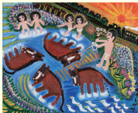
《ウマイレガワ》 | Umaire River 2001年 キャンバス、油彩