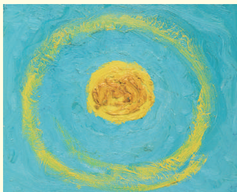
《シスコの月》 | Shisuko's Moon 2004年 キャンバスボード、油彩