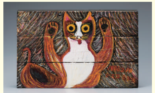
《ネコ》 | Cat 1996年 板、油彩