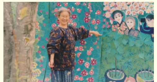
制作中のシスコさん