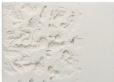
安部典子《Shadows and synchronicity》 2019年 作家蔵 ©Noriko Ambe

字を書いたり、本を読んだり、折り紙で遊んだり、わたしたちの生活に欠かせない「紙」。そんな紙に注目して、作品を作っている現代アーティストをご紹介します。