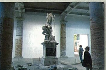
(写真10) ウルリス・フィッシャーによる蠅の彫刻。