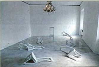
(写真7) ルクセンブルク館