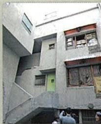
(写真2) イギリス館 マイク・ネルソン