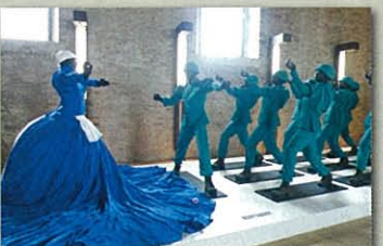
(写真9) 南アフリカ館