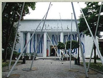
(写真1) ジャルディニー 入口