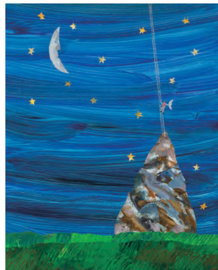
『パパ、お月さまとって!』最終原画、1985年、エリック・カール絵本美術館 © 1986 Eric Carle