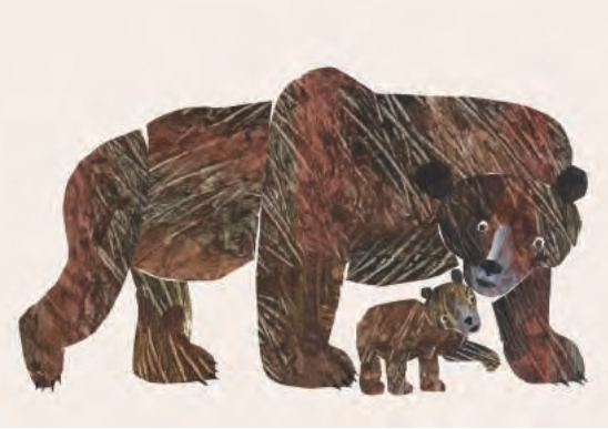
『こぐまくん、こぐまくん、なににみているの?』表紙原画、2006年、エリック・カール絵本美術館 © 2007 Eric Carle