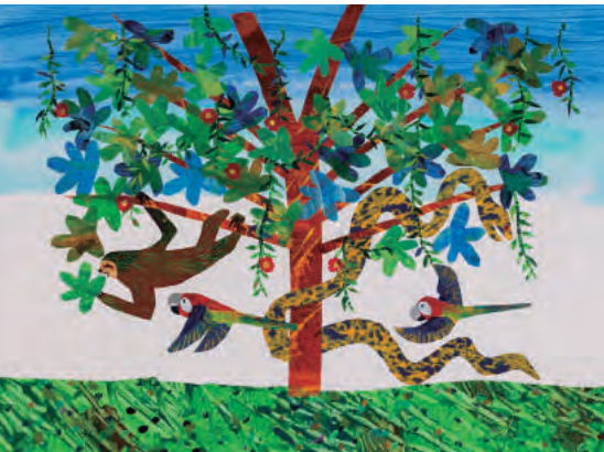
『ゆっくりが いっぱい!』最終原画、2001年、エリック・カール絵本美術館 © 2002 Eric Carle