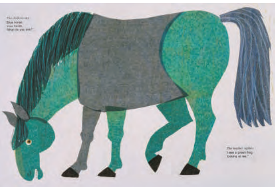
『くまさん、くまさん、なににみてるの?』最終原画、1983年、エリック・カール絵本美術館 © 1967, 1984 and 1992 Eric Carle