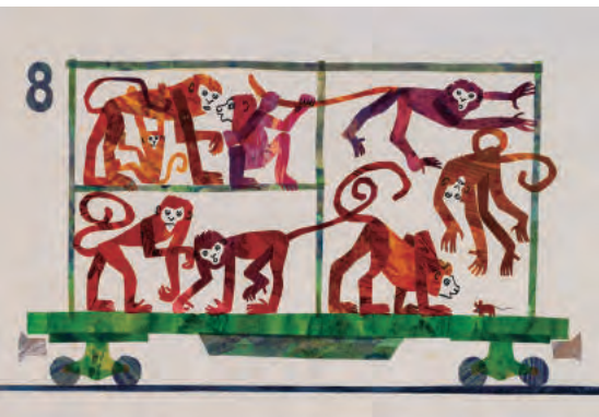
『1, 2, 3 どうぶつえんへ』最終原画、1986年、エリック・カール絵本美術館 © 1968 and 1987 Eric Carle