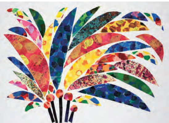
『うたがみえる きこえるよ』最終原画、1972年、エリック・カール絵本美術館 © 1973 Eric Carle

世界的ベストセラー絵本『はらぺこあおむし』で知られる、アメリカの絵本作家エリック・カール。カラフルで驚きに満ちた仕掛けが満載の絵本を数多く手がけ、代表作『はらぺこあおむし』を中心に、日本でも多くの子どもの親しまれています。