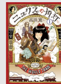
高浜寛 『ニクススの角灯』1巻書影 ©Kan Takahama

天草出身・熊本在住のマンガ家・高浜寛の個展。貴重な原画とともに、マンガに登場する高浜のアンティーク・コレクションを大公開。時代考証にこだわる仕事の深みと、歴史マンガの中に「いま」を映す鋭い感性に触れる展覧会です。