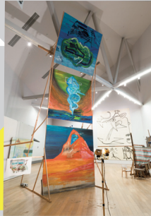
加藤笑平《mass of roman tic go/ちくご》2018年

九州を拠点にし、自らの生きる環境に根差した問題意識を持って主体的な活動を行う同時代の表現者7組を紹介するグループ展。それぞれの場所での実践例を通して、我々にとって切実な表現とは何かを考えます。