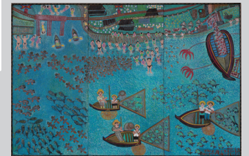
塔本シスコ《ふるさとの海》1992年 熊本市現代美術館蔵

宇城市出身の素朴派の画家・塔本シスコ。50代で油絵を始め、92歳で亡くなるまでの40年間に膨大な数の作品を描きました。あふれる夢や喜びを制作の原点としたシスコ・ワールドの全貌をご紹介します。過去最大の回顧展です。